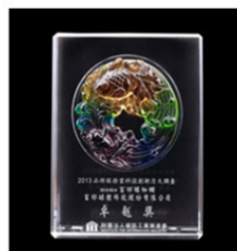
科技創新力-電子商務業冠軍