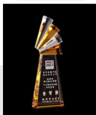
經濟部商業司金網獎